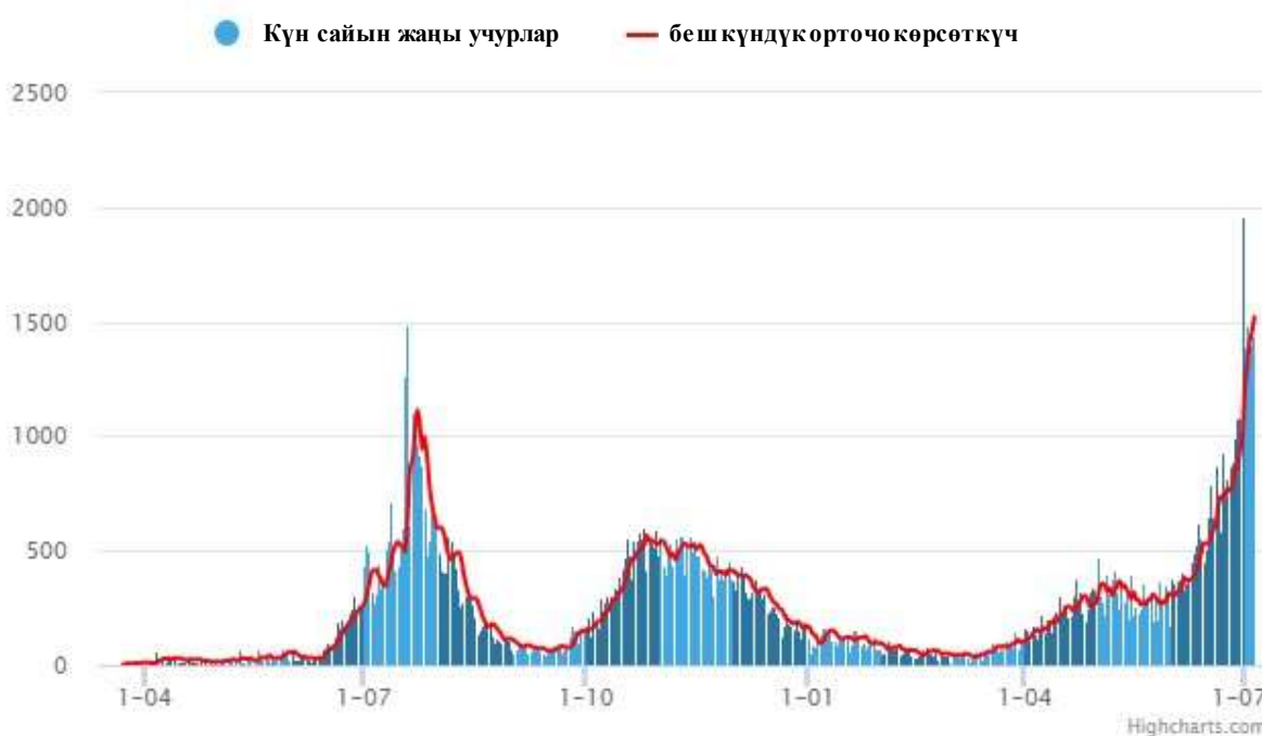
Диаграмма 1. COVID-19 жуккан статистикасы, 2020-2021 1

Мындан тышкары, Ош шаарындагы саясий партиялардын тирешүүсүнүн күчөө коркунучун жаратууда, мында жергиликтүү кеңешке ат салышып жаткан 5 партиянын өкүлдөрү үгүт кампаниясынын жүрүшүндө атаандаштары тарабынан мыйзам одоно бузулуп жаткандыгын жөнүндө билдиришкен. Көбүнчө, алар жергиликтүү бийликти административдик ресурстарды колдонду деп айыптап, өлкөнүн президентин буга көңүл бурууга чакырышты 2 .