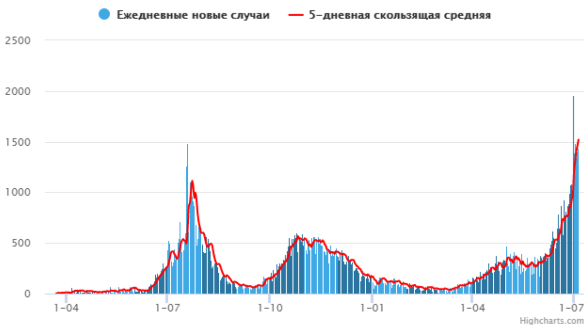
Диаграмма 1. Статистика зараженных COVID-19, 2020-2021 3